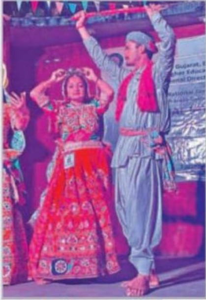
ગુજરાતના વિદ્યાર્થીઓ દ્વારા કચ્છી ડાન્સની પ્રસ્તુતિ કરાઈ હતી.